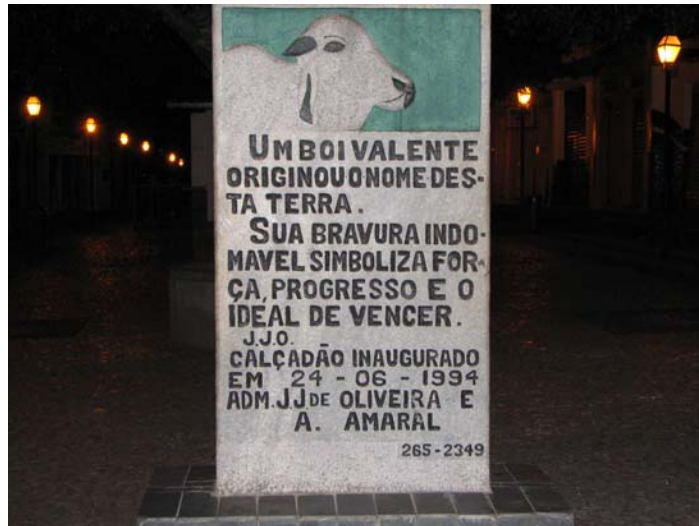
Figura 10 - Placa comemorativa de Valente

Segundo a tradição, conta-se que no local denominado Caldeirão, hoje sede do município de Valente, havia um ponto de parada onde os boiadeiros davam água aos rebanhos. Um boi teria se desgarrado do rebanho e não se deixava dominar. Teria sido grande a chegada de boiadeiros que para lá se dirigiam com o objetivo de dominar o boi valente. Assim iniciou-se o povoamento. Igualmente formou-se o Povoado Caldeirão Grande do Boi Valente. A denominação depois mudou para Caldeirão do Valente e, em 1900, com a criação do distrito, passou finalmente a ser denominado Valente.