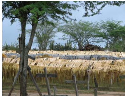
Figura 12 - Secagem da fibra de Sisal

Não vimos nestes municípios, conselhos concretizado burocratizados, a mas como extensão dos seus processo de participação mais amplo.