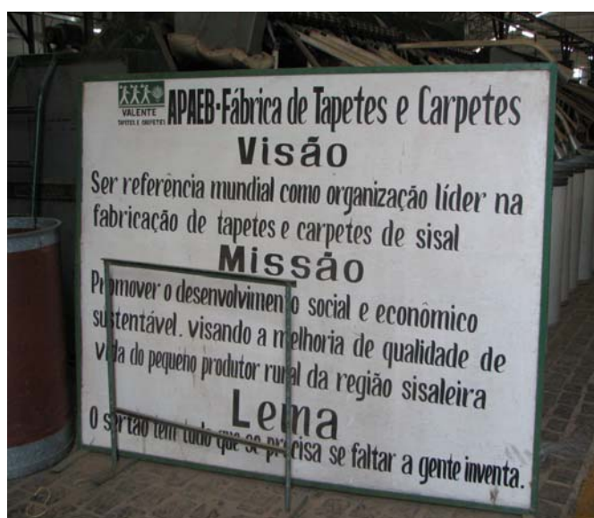
Figura 15 -Cartaz fábrica de tapetes APAEB

Em Valente, tomamos como eixos de fundação do movimento de participação a mobilização dos pequenos produtores, o surgimento do Movimento de Organização Comunitária (MOC) e a implantação da Associação de Pequenos Produtores do Estado da Bahia (APAEB) no município. Acreditamos que o sentido da participação, presente no seu Conselho Municipal de Educação, é fruto desses eventos. Os movimentos sociais se constituíram, em Valente, como força produtiva, inclusive com a implantação de uma fábrica de tapetes que são vendidos para o exterior.