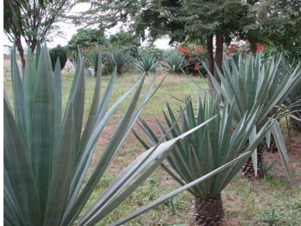
Figura 11 - Planta do Sisal

são os primeiros a buscar trabalho fora e a família acaba por recorrer ao trabalho infantil na sua terra. Igualmente nos períodos de boa cotação no preço do sisal, a força de trabalho do chefe da família é destinada à colheita do sisal, ficando as crianças e as mulheres nos cuidados das outras atividades do sistema de produção.