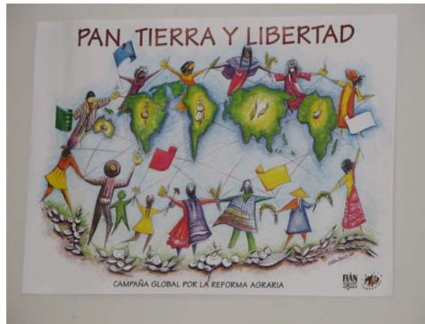
Figura 5 - Cartaz da Reforma Agrária no CODES

Neuza Cadore, uma líder dos movimentos sociais, conforme anteriormente referido, foi eleita para exercer seu mandato de prefeita no período de 2001 a 2004. Em 2005 os movimentos elegeram Valcyr para prefeito, para o período de 2005 a 2008.