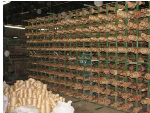
Figura 14 - Dos fios à trama

Um maior detalhamento do movimento de Valente pode ser encontrado nos trabalhos de Helenaldo Teixeira.