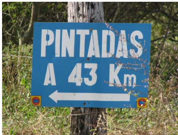
Figura 2 - Placa indicativa entre Ipirá e Pintadas.