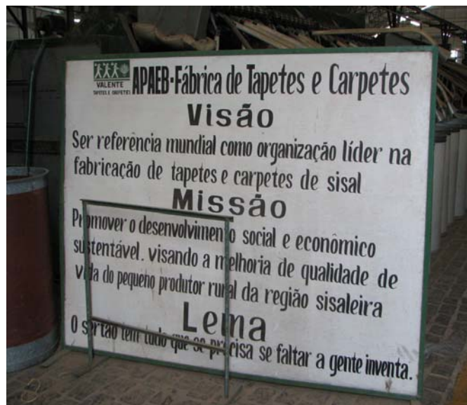
Figura 15 -Cartaz fábrica de tapetes APAEB

Em Valente, tomamos como eixos de fundação do movimento de participação a mobilização dos pequenos produtores, o surgimento do Movimento de Organização Comunitária (MOC) e a implantação da Associação de Pequenos Produtores do Estado da Bahia (APAEB) no município. Acreditamos que o sentido da participação, presente no seu Conselho Municipal de Educação, é fruto desses eventos. Os movimentos sociais se constituíram, em Valente, como força produtiva, inclusive com a implantação de uma fábrica de tapetes que são vendidos para o exterior.