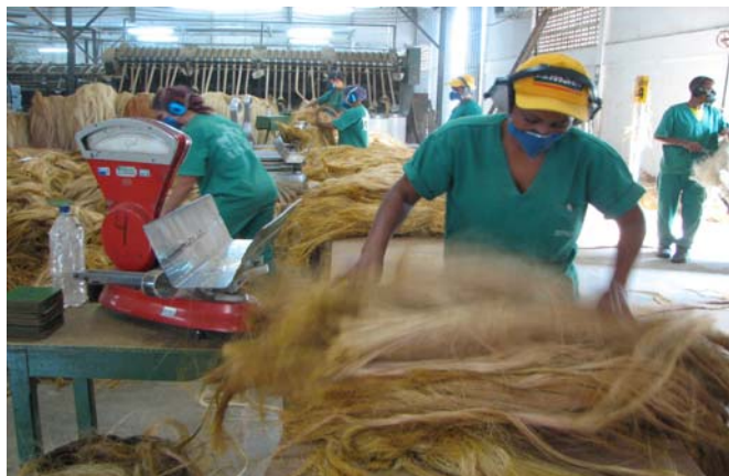
Figura 13 - Da fibra aos fios...

Entretanto, quando se lançaram na disputa pela prefeitura local, os movimentos sociais não conseguiram eleger o seu candidato em 2004. A polarização que aparece entre as duas lideranças no Conselho Municipal de Educação certamente reflete estas disputas pelo poder executivo local. No Conselho de Valente, a principal tensão que observamos a respeito da divergência entre Poder Público e sociedade civil foi quanto à formação dos conselheiros e seu perfil. Enquanto a representante da secretaria reclamava pelo desconhecimento técnico de normas, por parte dos conselheiros da sociedade civil, lideranças da sociedade civil defendiam uma formação política.