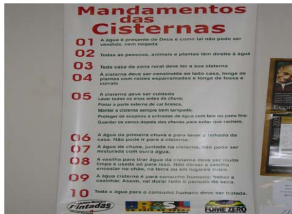
Figura 8 - Os 10 mandamentos da Cisterna

Na cooperativa de crédito, a ênfase é dada para o papel do associado através de um cartaz que explicita os seus deveres. Ainda no Codes, um anúncio cita os dez mandamentos das cisternas, onde os três primeiros anunciam: “A água é presente de Deus e como tal não pode ser vendida, nem negada”, “Todas as pessoas, animais e plantas têm direito à água” e “toda casa da zona rural deve ter a sua cisterna”, mandamento que se tornou compromisso e que já foi concretizado em 90% das moradias.