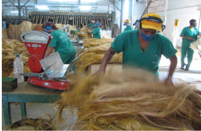
Figura 13 - Da fibra aos fios...

Entretanto, quando se lançaram na disputa pela prefeitura local, os movimentos sociais não conseguiram eleger o seu candidato em 2004. A polarização que aparece entre as duas lideranças no Conselho Municipal de Educação certamente reflete estas disputas pelo poder executivo local. No Conselho de Valente, a principal tensão que observamos a respeito da divergência entre Poder Público e sociedade civil foi quanto à formação dos conselheiros e seu perfil. Enquanto a representante da secretaria reclamava pelo desconhecimento técnico de normas, por parte dos conselheiros da sociedade civil, lideranças da sociedade civil defendiam uma formação política.