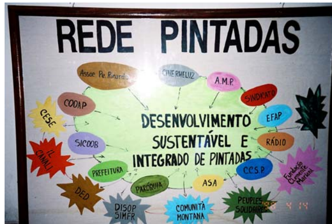
Figura 3 - Diagrama de organização da Rede Pintadas

projetos que vão surgindo. Tem início o Projeto TAPI - Tecnologia Apropriada em Pequena Irrigação, o Projeto AJUP – Associação de Jovens Pintadenses, a Associação de Mulheres de Pintadas (1993), a Associação Padre Ricardo, a Escola Família Agrícola – EFAP (1996), a rádio comunitária – RADACOM (1997) – atualmente desativada -, a Cooperativa de Crédito – Credipintadas / Sistema de Cooperativas Brasileiro (Siccob). Pelo PROCAP – através do Siccob – é financiado um Projeto de Caprinocultura e Ovinocultura, a ASA (Associação de Apicultores), além da formação de um grupo de teatro (Associação Arte Cênica Rheluz). Assim a comunidade foi criando uma malha de associações e projetos que a fortalecia na sua união e trazia novas possibilidades para o município (em 1985, através de Lei Estadual, Pintadas é desmembrada de Ipirá passando a constituir-se em município).